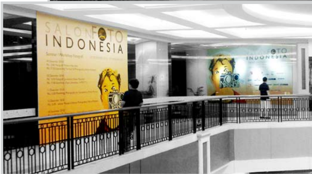
SALON FOTO XXXI, BATAM & GRAND INDONESIA