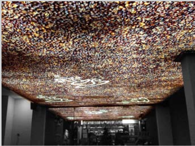
BLACK CANYON COFFEE