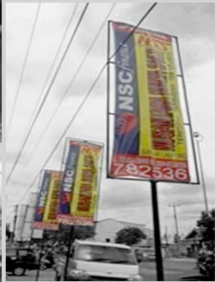
PT. NUSANTARA SURYA SAKTI