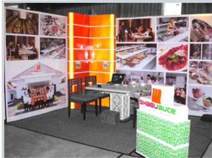
SHABU AUCE, SEMARANG