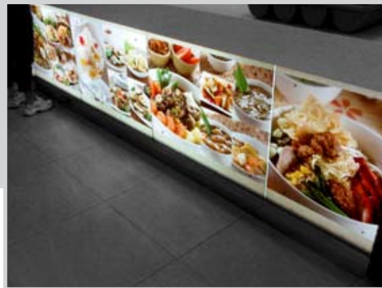
RED PEPPER, PLAZA INDONESIA