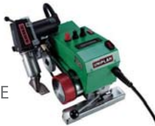
LEISTER UNIPLAN E

Baik penyelesaian dengan selongsong ataupun hanya tekukan biasa, kami hanya menggunakan alat pemanas terbaik di dunia untuk menjamin daya rekat.